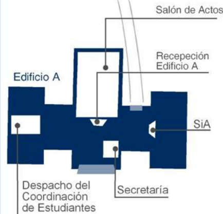
Edificio A Primera planta