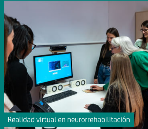
Realidad virtual en neurorrehabilitación

Nuestro programa cuenta con un contenido de prácticas que garantizan la adquisición de las competencias fundamentales. La Salle Centro Universitario te ofrece una gran variedad de recursos mediante convenios firmados con más de 100 centros. Realizarás 1.200 horas de formación práctica con la mejor metodología para adquirir dichas competencias bajo la supervisión de un Terapeuta Ocupacional experimentado al mismo tiempo que un tutor académico individualizado. Rotarás por cuatro poblaciones diferentes: Pediatría, Adultos Físicos, Geriatría, Salud Mental o Discapacidad Intelectual. ...y lo que nos diferencia de los demás: el ratio de supervisión será de 1 o 2 alumnos máximo por Terapeuta Ocupacional en los centros. Para potenciar aún más tu perfil profesional te ofrecemos, la posibilidad de realizar prácticas extracurriculares voluntarias, mediante la participación en proyectos con entidades externas.